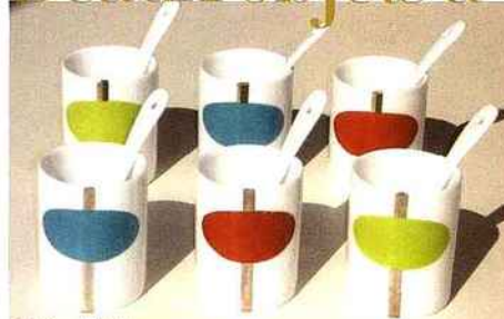
Création de Bo-M.