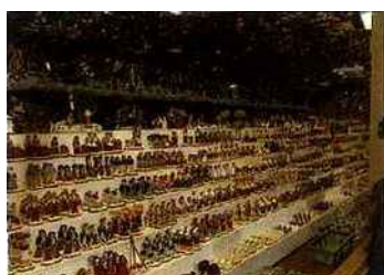
Foire aux santons de Marseille

Avis aux amateurs et aux collectionneurs de santons. La cité phocéenne accueille le temps des festivités de fin d'année une foire aux santons dont les origines remonteraient à la Révolution française. Ce qui en fait le plus ancien événement de ce type. Comme chaque année, l'événement aura lieu sur les allées du Meilhan du dernier dimanche du mois de novembre au 31 décembre. Le début de la foire sera marqué par une messe des santonniers célébrée en provençal en l'église des Réformes. Du 29 novembre au 31 décembre 2009 Allées du Meilhan