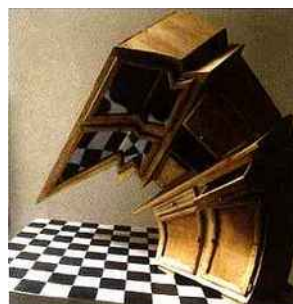
Laurent Martin, Sans Titre 2009 © Laurent Martin

Pendant quatre jours, 130 peintres, créateurs de volumes ou