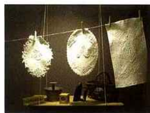
De haut en bas © Anne Katherine Renaud © Herve Piraud