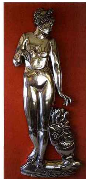
Ci dessus Renato Montanara Venus avec Donald 2009 © Renato Montanara Ci dessous Audrey Canales K 2009 © Le Projet K